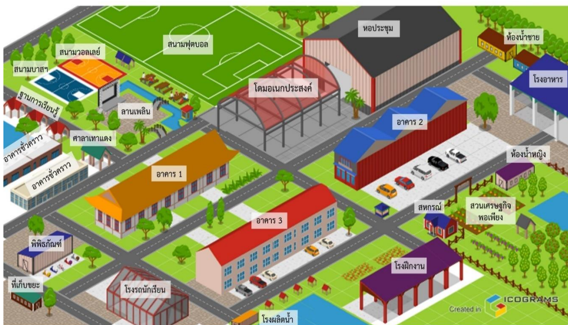
แผนผังโรงเรียนแตลศิริวิทยา อำเภอศีขรภูมิ จังหวัดสุรินทร์